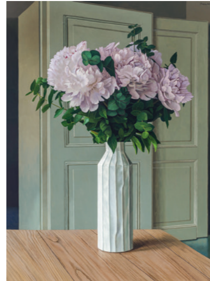
/Kunsthalle 02/ Jan-Peter Tripp Flowerpower / 2023 Acryl auf MDF 80x60cm