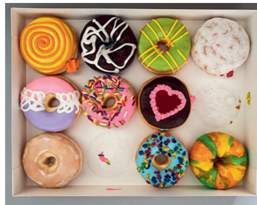
/Kunsthalle 03/ Peter Anton Cosmic Donuts 2023 / Mixed Media 71x94x15cm / © Galerie von Braunbehrens