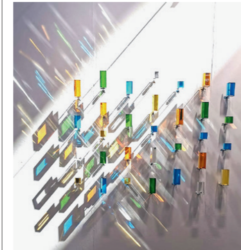
/Kunsthalle 04/ Bongchull Shin The things we did last summer 2022 / Glas laminiert 80x122x11cm

Die Stuttgarter Galerie von Braunbehrens zeigt Kunst aller Gattungen von renommierten Künstlerinnen und Künstlern. In den Galerieräumen am Feuersee finden auf rund 500 qm Fläche regelmäßig museale Wechselausstellungen mit international erfolgreichen Künstlerinnen und Künstlern statt. Über Stuttgart hinaus werden sie Sammlerinnen und Sammlern auf nationalen und internationalen Messen bekannt gemacht.