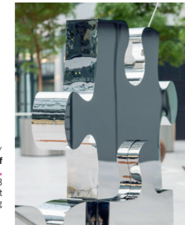
/Hoenes-Saal/ Georg-Friedrich Wolf The Missing Piece, Weltenbild II / 2013 Stahl Spiegelglanz / Unikat 140x120x80cm, 280kg