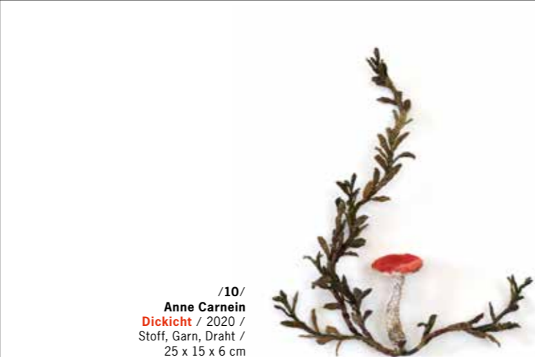
/10/ Anne Carnein Dickicht / 2020 / Stoff, Garn, Draht / 25 x 15 x 6 cm

Was alle vereint, ist das, was man unter Materialintelligenz definieren könnte. Die wesentlichen Züge ihrer Kunst decken die Bereiche der abstrakten Kunst (teilweise von der Konkreten Kunst kommend, jedoch frei vom historischen Korsett), über die Konzeptkunst und Minimal Art, bis hin zu lyrisch-abstrakten und vermeintlich realistischen Positionen ab.