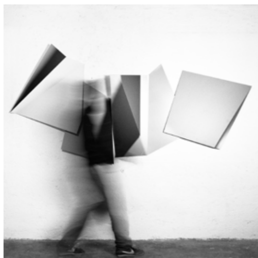
/08/ Florian Lechner 16020903 (Raumbild) / 2016 / räumliche Intervention aus plastischem UVDirektdruck auf Alu-Dibond / 133 x 266 x 12 cm