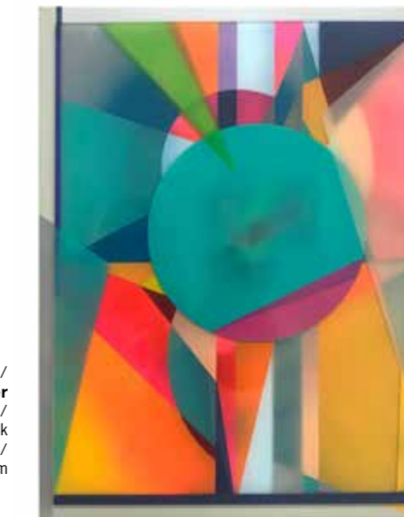
/05/ Dana Greiner Preplex 089 / 2020 / Sprühlack auf Acrylglas / 43 x 33 cm