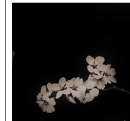
/06/ Steffen Diemer Kirschblüten / Nassplattenkollodium, Photo-Unikat / 40 x 40 cm