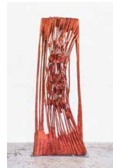
/02/ Armin Göhringer o.T. / 2019 Mammut, geölt / 230 x 90 x 2 cm