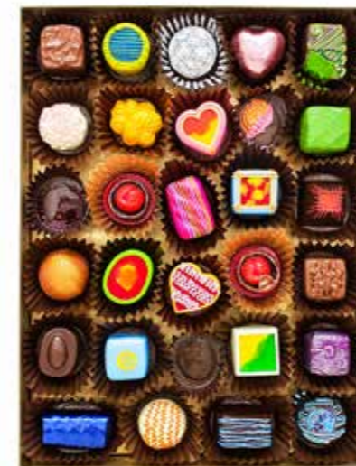
/03/ Peter Anton Opulent Gold Assortment / 2019 / Mixed Media / 122 x 81 x 13 cm