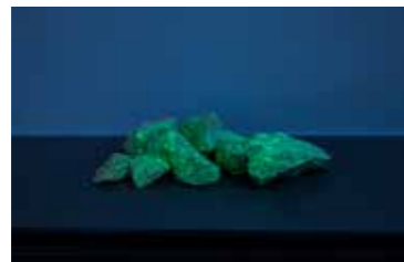
Adam Cmiel, Zaubersteine (Break on Through) 2014, Phosphorisierende Steine aus der Wand der Kunstakademie Karlsruhe, ©Adam Cmiel

Adam Cmiel gestaltete für das zweite Obergeschoss der Villa eine Installation aus Werken, welche die Räume zu einem Ort der Erfahrung und des Erlebens machen sollen. Hintergrund seiner Arbeiten sind die Bemühungen des Wissenschaftlers Dr. Ypsilon, die Probleme der Welt zu lösen. Da der Forscher auf der Erde keine nachhaltigen Ansätze fand, sendete er den Weltraumpiloten Galaktolator ins Weltall. Auf Basis von Testreihen im Labor des Forschungszentrums für den befreiten Geist konnte eine Reihe von Produkten entwickelt werden, die Cmiel für seine Installationen kombiniert und je nach Zusammenhang in neue Wirkungszusammenhänge stellt. Ziel ist hierbei die Entschleunigung des Alltags durch die Werkrezeption, aus der wiederum eine Läuterung resultiert, die positive Eigenschaften der Besucherinnen und Besuchern stärkt. Hierfür stehen stellvertretend auch die vier Türen, welche die Installation umgeben. Eine der Türen ist geschlossen und steht damit für das Unbekannte, Unterbewusste. Eine zweite Tür ist leicht geöffnet und symbolisiert das Unbekannte, welches es zu ergründen gilt. Die dritte Tür ist offen und appelliert an den freien, geöffneten Geist. Nach der Verwandlung können die Besucherinnen und Besucher durch die vierte Tür wieder hinausgehen.