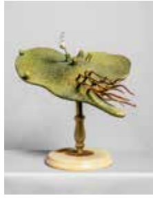
Simone Demandt P.M. # 18, Vorkeim eines Farns, Bot. Gfw., 2015 Pigmentdruck auf Papier, © Simone Demandt & VG Bild-Kunst Bonn 2018

Jahrhundertwende zum 20. Jahrhundert. Die meist aus Holz, Pappmaché, Gips, Draht und Zelluloid gefertigten Modelle von Blattquerschnitten, Blüten, Samenkapseln oder Pflanzenkrankheiten dienten als übergroße Lehr- und Anschauungsobjekte für Forschung und Demonstration organischer Prinzipien. Demandts Fotoarbeiten verdoppeln einen den Modellen innewohnenden Zeigemodus, indem eine fotografische Rekonfiguration der Modelle stattfindet. Durch die Vergrößerung und ihre Platzierung vor neutralem Hintergrund erhalten die Gebrauchsspuren aufweisenden Objekte jedoch eine eigentümliche Präsenz, wobei einige Modelle die Anmutung moderner Skulpturen besitzen.