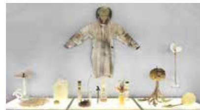
Mario Urlaß, Hybride , 2018, Objektinstallation auf Leuchttischen / Anthropomorphus, 2016, Objekt aus Schweißerkittel und Pfeilschwanzkrebs © Mario Urlaß & VG Bild-Kunst, Bonn 2018