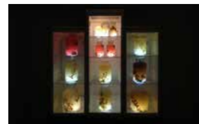
Daniel Bräg 3 Kühlschränke , 2018 Kühlschränke, Holzsockel, Gelatine, Gläser, blühende Äste aus dem Park der Villa Rot, © Daniel Bräg VG Bild-Kunst, Bonn 2018