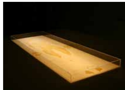
Sonja Bäumel Expanded Self , 2012 Plexiglas, Fotografie, Neonröhren, Aluminium © Sonja Bäumel

Für Sonja Bäumel stellt die Erforschung von Bakterien und ihrer bildnerischen Möglichkeiten eine Basis künstlerischen Schaffens dar. Für das Projekt Expanded Self (etwa: erweitertes Selbst) nutzte die Künstlerin eine übergroße Petrischale als Leinwand und den eigenen Körper als Pinsel. Sie legte sich unbedeckt in eine Wanne, die mit einem Nährboden aus Agar gefüllt war. Nach wenigen Tagen wurden die Aktivitäten der Körperbakterien sichtbar und schufen ein beeindruckendes Bild des Wachstums und eine völlig neue Art des Selbstbildnisses. Die Künstlerin vermerkt hierzu: „Dieser Abdruck eines menschlichen Körpers ist eine Art Metapher für neue Sichtweisen unserer Person. Jeder von uns ist so viel mehr, als er denkt. Wenn wir das genetische Material all unserer Einwohner zusammenführen, enthält es zehnmal mehr Informationen als unsere eigene DNA. Wir beginnen erst zu verstehen, wie diese erstaunliche Gemeinschaft verschiedener Lebensformen auf uns wirkt und uns gleichzeitig arbeiten lässt“ 7 . In diesem Sinne ist Bäumels künstlerisches Werk auch ein Beitrag zum Verständnis und zur Visualisierung der Möglichkeiten wissenschaftlicher Forschungen und des Potenzials von Bakterien als Kooperationspartner für die Kunst.