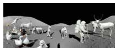
Krassimir Terziev Apollo Albino Programme 2017, Fotomontage, Pigmentdruck auf Papier, auf Aluminium aufgezogen