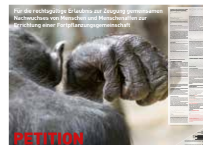
Reiner Maria Matysik Plakat zum Referendum zum Mitnehmen © Reiner Maria Matysik

In dem Referendumsentwurf heißt es „Menschenaffen besitzen jeweils 48 Chromosomen, Menschen besitzen 46. Vermutet wird, dass während der Entwicklung zum heutigen Menschen zwei der 48 Chromosomen miteinander verschmolzen sind.“ Die Frage, wie der Zustand vor der Ver-