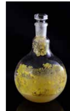
Theresa Schubert somniferous observatory 2011 – 2013, LightJet-Print auf Aludibond

Welches ästhetische Potenzial steckt in Mikroben, Bakterien, Flechten oder Pilzen? Und was können wir aus den Strukturen ihres Wachstums lernen? Theresa Schubert geht diesen und anderen Fragen mit ihren künstlerisch motivierten Experimenten auf den Grund. Hierbei verschränken sich Forschungsdrang, philosophische Fragestellungen und ästhetische Gestaltung aufs Schönste, wie es etwa die vier Fotoarbeiten mit dem Titel somniferous observatory (etwa: schlafinduzierendes Observatorium) demonstrieren. Hierzu nutzte Schubert Schleimpilze des Typs Physarum Polycephalum. Diese besonderen Wesen interessieren die Forschung schon länger, da man bei ihnen intelligente Handlungsweisen festhalten kann. Das Wachstum dieser Lebewesen, die weder Pflanze noch Tier sind, ist äußerst effizient, sodass Schleimpilze mitunter als Modelle für Netzwerkoptimierung, so etwa bei der Städteplanung oder im Medienbereich, genutzt werden. Schubert untersuchte in ihrem Projekt, was passiert, wenn der Organismus durch andere Substanzen beeinflusst wird. Sie verabreichte ihren Exemplaren beruhigende und psychoaktive Substanzen, wie Cannabis, Tabak und Baldrian. Die Ergebnisse dieser Induktionen sind in den ausgestellten Fotos sichtbar.