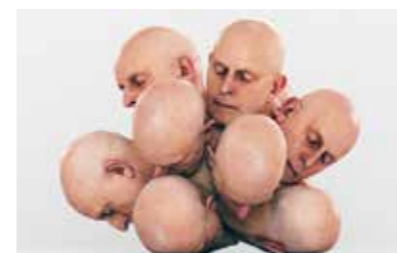
Simon Christoph Krenn Parasitic Endeavours 2017, Animation © Simon Christoph Krenn

Beherrschen wir erst die DNA, so die Aussage, dann kann der Mensch Gott spielen und Lebewesen nach seinen Vorstellungen schaffen. Schon heute beschäftigt sich die Bioethik intensiv mit diesen Themen. Auf der einen Seite wäre es möglich, tödliche und vererbare Krankheiten auszuschalten. Auf der anderen Seite stellt sich die Frage, welche Folgen der menschliche Perfektionswille haben kann. Eine Version wäre, so legt es Yoldas Arbeit nahe, dass man den eigenen Nachwuchs individuell zusammenstellen kann.