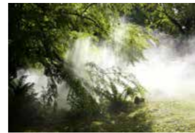
Effektschmiede Nebelinstallation für das „Fürstliche Gartenfest“ Schloss Wolfsgarten, 2015

Die Werke dieser Ausstellung zeugen von der Doppelnatur des Themas. Auf der einen Seite steht die Faszination für naturwissenschaftliche Innovationen und deren Ästhetik, auf der anderen stehen die (imaginierten) Gefahren des menschlichen Forschungsdrangs.