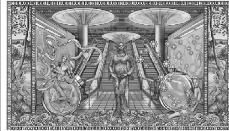
Margret Eicher It's a Digital World , 2018, Digitale Montage, © Margret Eicher & VG Bild-Kunst, Bonn 2019